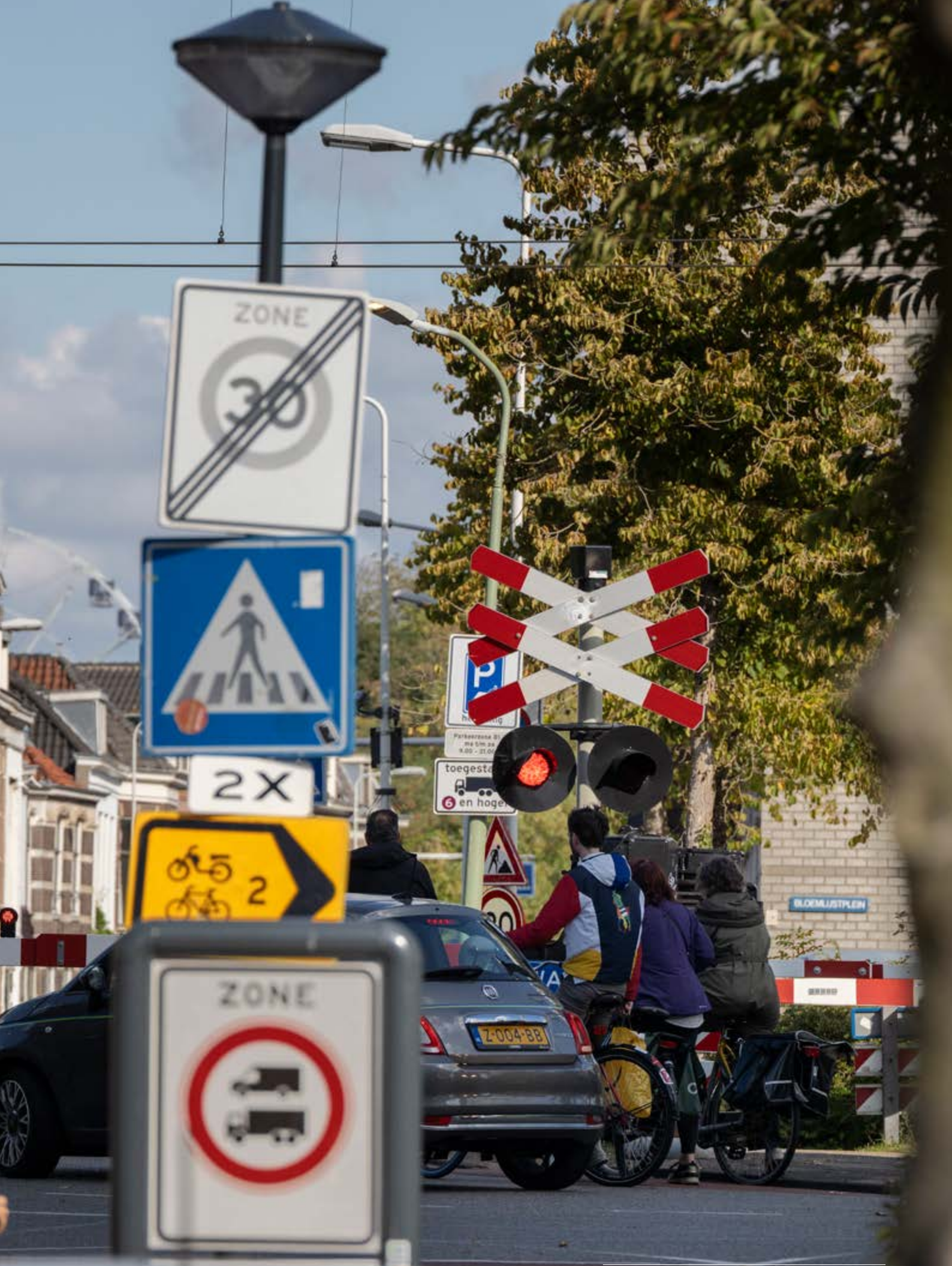
Spoorwegovergang ter hoogte van de Rijnzichtbrug.