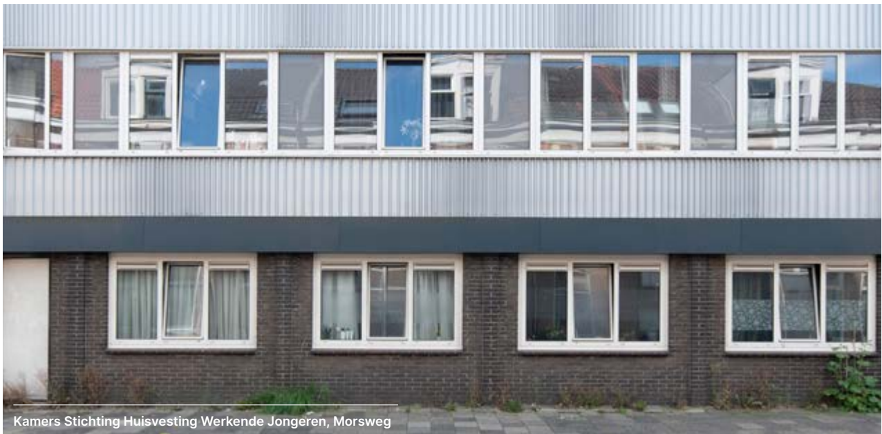
Kamers Stichting Huisvesting Werkende Jongeren, Morsweg