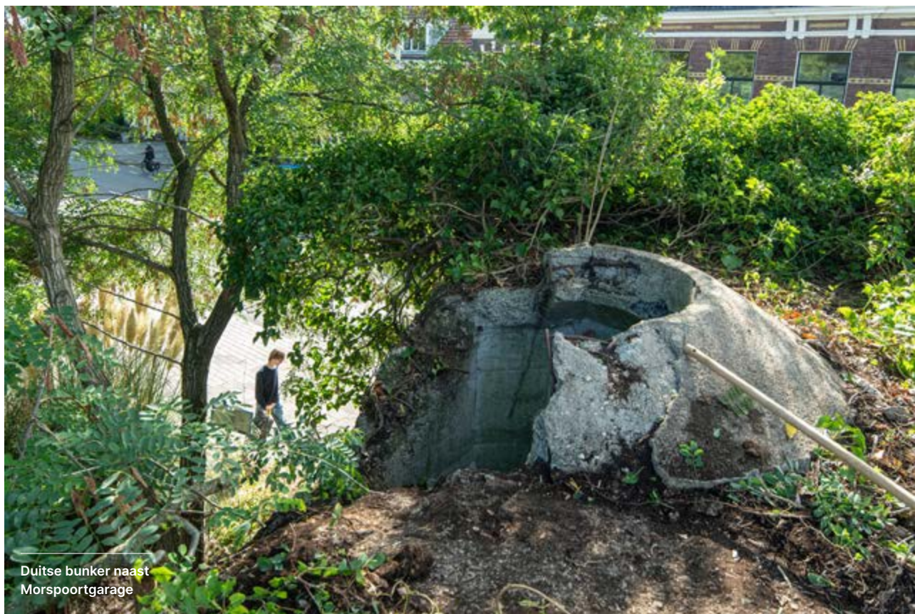
Duitse bunker naast Morspoortgarage