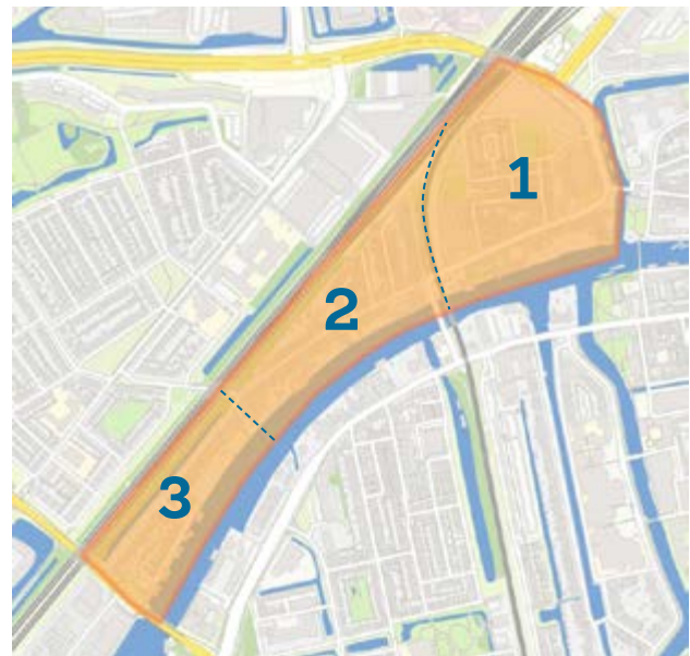
Plattegrond Transvaal

Transvaal vormt samen met de Lage- en Hoge Mors de wijk de Mors. Strikt genomen is het één buurt, maar wel één die bestaat uit allemaal kleine buurtjes, zegt een lid van de wijkvereniging. Als de wijkvereniging erover praat, gaat het voor het gemak over Transvaal 1, 2 en 3.